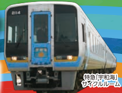
特急「宇和海」サイクルルーム